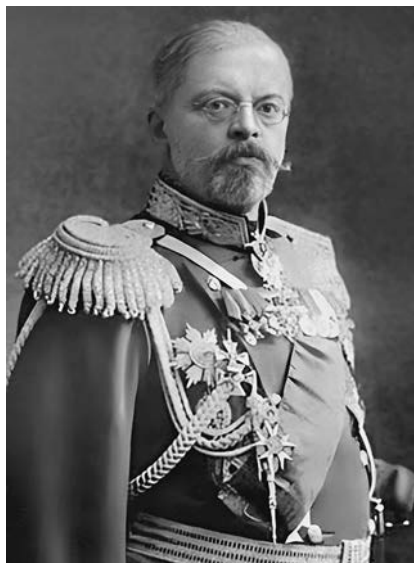
Александр Федорович Редигер

звался примерно в духе репортажей Михайлова, но в Третей думе, наконец, собрались люди, с которыми можно было работать. Министр лично инициировал неформальные контакты с депутатами. В начале декабря 1907 г. Редигер пригласил Гучкова и других членов Комиссии государственной обороны, по его выбору, на чаепитие, в ходе которого откровенно обрисовал депутатам тяжелое положение армии и обозначил неотложные финансовые нужды военного ведомства 212 . По словам Гучкова, Редигер продолжил время от времени устраивать собеседования с членами Комиссии 213 . Более того, министр соглашался сообщать им секретные сведения 214 .