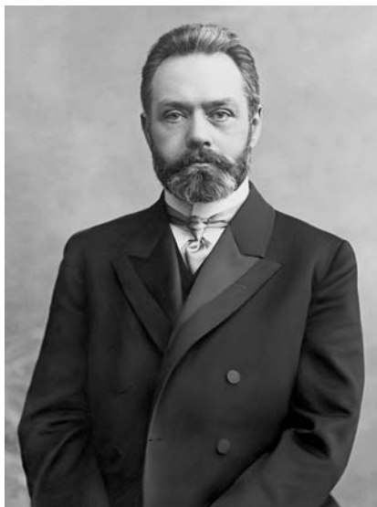
Александр Иванович Гучков. 1917 г.