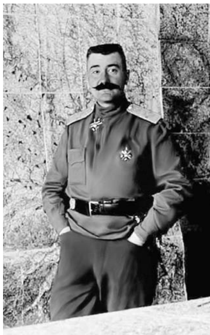
Николай Николаевич Головин

военная школа», в котором излагалась программа реформирования Академии генштаба. «В основе постановки учебного дела военной академии должна лежать идея прикладного обучения и вытекающее из этой идеи — объединение в одних руках прикладных и теоретических занятий по каждому отделу» 266 — так формулировалась главная идея. Введение «прикладного метода» обучения предполагало увеличение числа практических занятий по тактике в ущерб теории и истории, что необходимо влекло за собой изменения в расписании. Практические занятия, разумеется, существовали в Академии и раньше, но проводились в форме решения офицерами задач по тактике на дому с последующим разбором ошибок